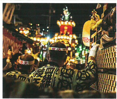
小江戸川越観光協会賞