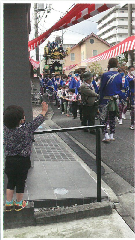
川越市議会議長賞