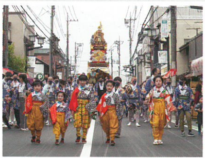
東日本旅客鉄道賞