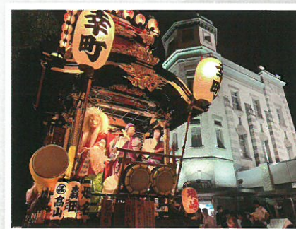
川越商工会議所賞